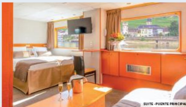
SUITE - PUENTE PRINCIPAL