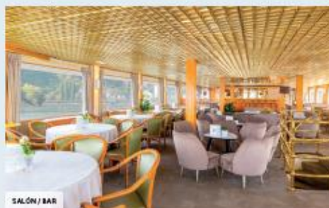
SALÓN / BAR

Completamente reformado en 2011, el MS Leonardo Da Vinci es un barco de 4 anclas a escala humana, que mide 105 m de largo y 11,40 m de ancho. Tiene capacidad para 143 pasajeros, en 72 camarotes dispuestos en dos puentes. Cada uno de ellos, cómodo y espacioso, cuenta con todas las comodidades y ofrece las mejores condiciones para la estancia.