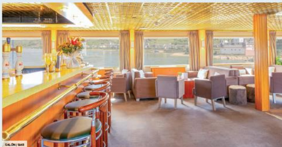
SALÓN / BAR

Es uno de los artistas más famosos de la historia el que ha dado su nombre a este barco de 4 anclas que navega por el Rin, un río con múltiples riquezas culturales y naturales.