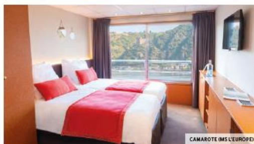
CAMAROTE (MS L'EUROPE)