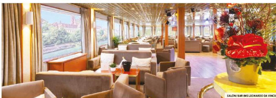
SALÓN / BAR (MS LEONARDO DA VINCI)