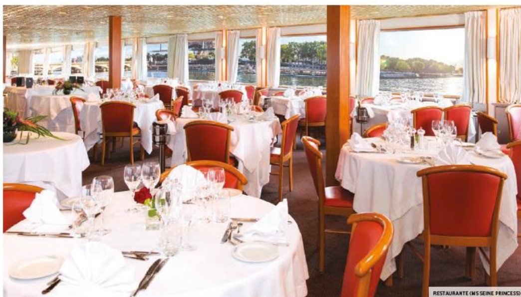
RESTAURANTE (MS SEINE PRINCESS)

Ofrecen un confort y una funcionalidad óptimos en un entorno cálido. Los camarotes, totalmente equipados, están todos situados por encima del nivel del agua, ofreciendo una vista panorámica del paisaje.