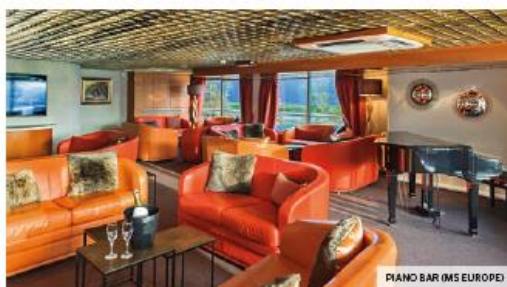
PIANO BAR (MS EUROPE)