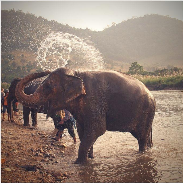
Bathing the elephants Elephant Nature Park, Chiang Mai